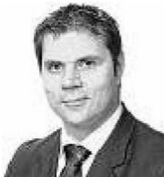
Von Gianni Meleleo*

«Wir besitzen ein Einfamilienhaus und verfügen durch den Verkauf unseres Geschäfts über ein Vermögen, das uns einen sorgenfreien Lebensabend ermöglicht. Was ist aber, wenn wir eines Tages pflegebedürftig werden und in ein Pflegeheim müssen? Wir möchten nicht, dass das gesamte Ersparnis eines Tages an ein Alters- oder Pflegeheim geht und unsere Kinder nichts erben oder sogar für uns aufkommen müssen.»